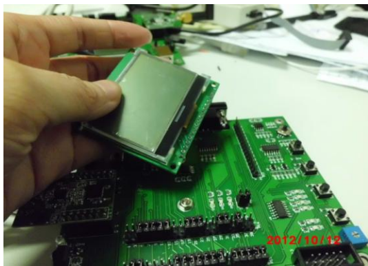
照片 8 组装发射芯片场景

到现在为止，我们创新性实验项目的进度算是比较不错的，前期的大半时间都是在做准备和各种项目尝试，到寒假之前我们才算是真正地完成了项目的大半部分。虽然还没有完善到近乎完美的地步，只是基本功能实现了，但已经算是成功了一半，后期的工作将会更有针对性，我们的实验方向将更加明确。注重细节是我们一直秉承的习惯，因为细节决定成败。我们会认真对待实验过程中的每一个细节，将项目进行到底！