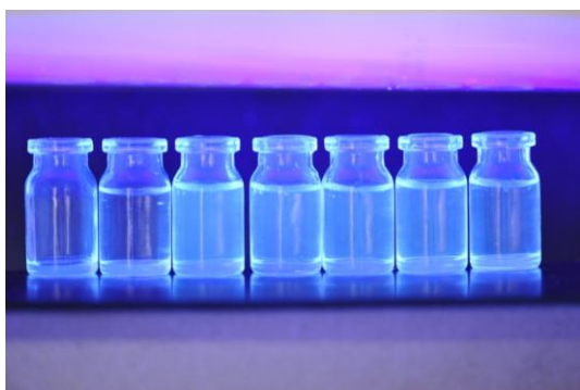
照片 15 紫外照射下的荧光碳量子点

作为一个即将毕业的大四学生，这个学期我最主要的事情便是找工作和完成毕业论文。由于有了创新性实验一年来的基础，在完成毕业论文的实验上我得心应手，能很快地投入到毕业设计的实验中。这比当初刚开始做创新性实验的我少走了许多弯路，知道怎么快速地查阅文献、怎么设计实际可行的设计方案等，所以我比周围同学的进度快了很多。虽然这学期刚开学不久，但是，我毕业设计的实验已经初显成果。