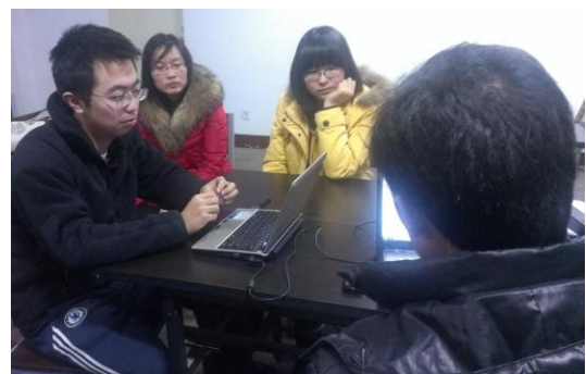
照片 6 我们一起讨论

诗人说：“生命是一株常开不败的花，无论树木枯萎，花朵凋零，我也愿零落成泥滋润大地。”哲人说：“生命是一段旅程，即便是旅途终止，我也会用最后一丝力气传递生命可贵的气息。”在看似平凡的人生旅途中，不知有多少意志不坚之人在挫折面前失去信念一蹶不振。面对挫折，我们不应放大痛苦，需要乐观面对。