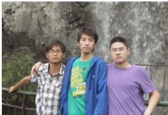
照片 7 部分团队成员

一笔宝贵财富。在此感谢学校给了我们这次锻炼的机会，最后，我们用一句话来总结这次实践的心得体会：过程是艰辛的，但结果是美好的，我们要积极地面对困难，挑战自我。