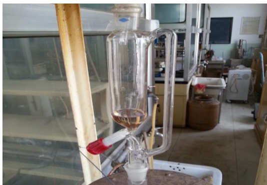
照片 17 恒压滴液漏斗

年前的抽查汇报和中期汇报检查会议,是一段历程的结束,也意味着一个新阶段的开始。从中我们收获了很多有价值的启示,包括如何地正确使用PPT来表达我们的内容,如何让听众更好地理解我们的所做所为,同时我们懂得了细节的重要性,有时看起来无关紧要的一点,在后来的总结中却发现其实是非常重要的环节。通过和其他实验小组的交流,我们看到了自己的不足和差距,明白现在虽然取得了一点成果,但是万万不能骄傲自满。漫漫长途,行百里者,九十半。以上的种种,最终让我们产生了质的变化。