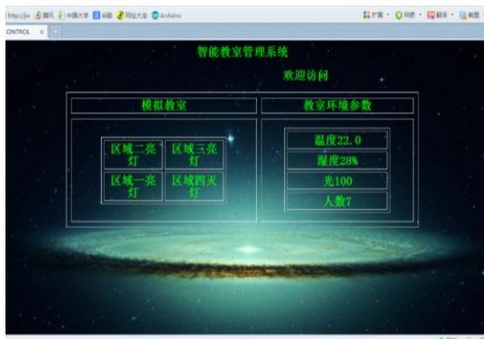
照片 5 远程访问网页

大四期间，我们主要做的就是对已经成型的项目进行优化和收尾工作。经过两年的磨炼，我们的团队懂得了团结协作，低年级的成员也成为其他团队的领导人，这是我比较欣慰的地方。经过两年的时光，我懂得了一个道理：一个团队的成功，不是靠少数人，而是需要大家共同的努力和付出，一个成功的团队，它的每一个成员一定会成为独当一面的能人。