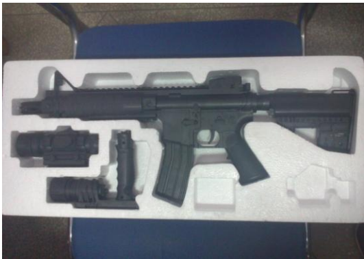
照片 13 准备改装的实验用枪