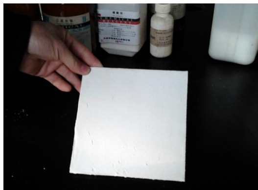
照片 1 已做好的无机涂料样品

在实验开始时我就遇到了问题,最大的一个就是有机硅丙烯酸酯树脂这种反应物是自己制备还是购买原材料,通过相互比较我选择自己制备这种物质,并且已经确定了药品和流程,我希望经过我的努力尽可能解决接下来的问题,可以很好地达到实验预期目标。