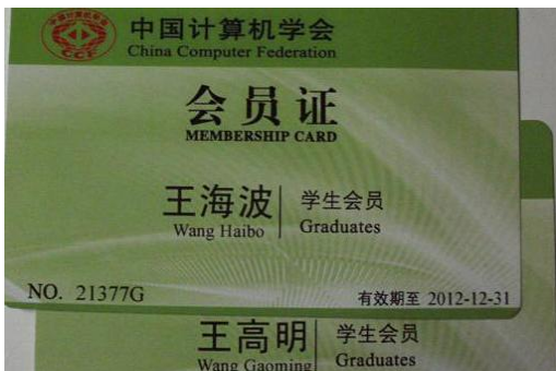
照片 3 中国计算机学会证