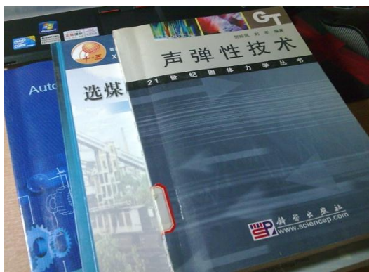
照片5 假期看的资料