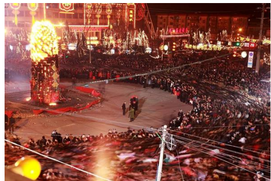
照片 4 怀仁旺火

寒假一个令人期盼的时节，一段令人欣喜的日子，在那辞旧迎新喜气洋洋的季节，我们忙碌着，充实着，收拾着往日的心情，憧憬着来日美好的生活。