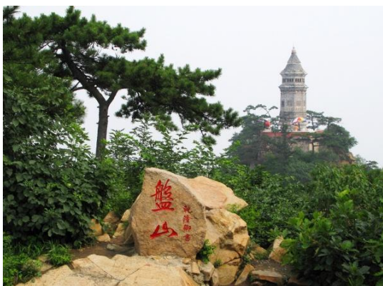
照片6 京东第一名山——盘山

欢迎到我的家乡来，我会带你尽情领略盘山美：春日，山花烂漫、燕舞蝶飞；夏天，峰峦叠翠、瀑布腾空；深秋，层林尽染、百果飘香；严冬，玉岭琼峰、青松增翠。